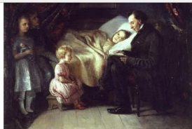
Элизабет Джерихау-Бауманн. Андерсен читает сказку «Ангел» дочери художницы, 1862 г. Картина находится в Дании.

Художница описывает обстоятельства того, как была написана эта картина.